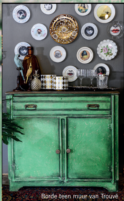
Borde teen muur van Trouvé

PROJEKGIDS Harde werk 3/10 Vaardigheidsvlak 4/10 Tyd nodig 3 uur