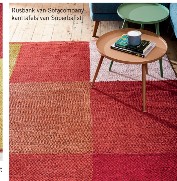
Rusbank van Sofacompany; kantafels van Superbalist

3 Verf nou elke tweede blok in 'n ander kleur – gebruik enige oorskiet-krytverf wat jy het. Verdun dit effens met water indien nodig sodat dit makliker versprei. 🏠